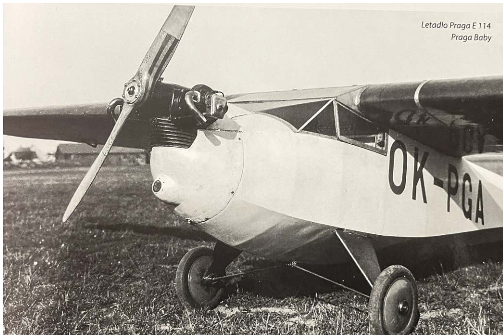
Letadlo Praga E 114 Praga Baby