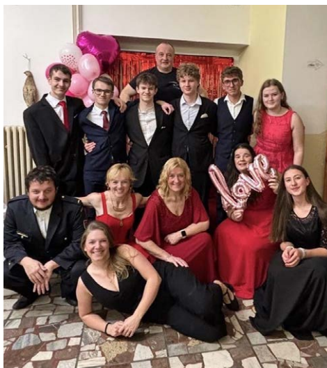
Ples obce a SDH 14. 2. 2026