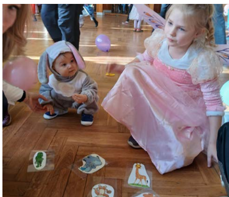
Dětský karneval 28. 2. 2026